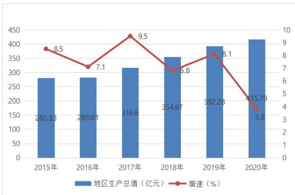
图 1-1 2015—2020 年城中区地区生产总值及增速